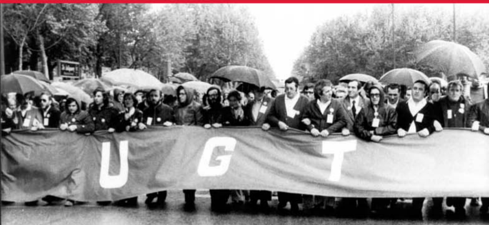
Manifestación del 1º de mayo de 1978 en Madrid, convocada por UGT, CC00 y otros sindicatos, por primera vez legal desde la guerra civil: "La lucha sindical continúa"

El 1º de mayo de 1978 se celebró la primera manifestación legal desde la restauración democrática. Bajo el lema "la lucha sindical continúa" se convocaron manifestaciones en todas las capitales españolas a las que acudieron miles de trabajadores en defensa de sus reivindicaciones.